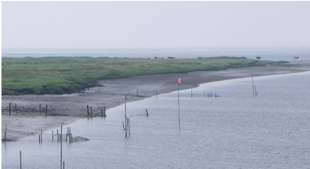
En af seværdighederne ved Kammerslusen er at kunne følge med i tidevandets skiften.

Kammersluseområdet, som et yndet besøgsmaal for både lokale og turister, skal fortsat styrkes, da sluseaktiviteten og Vadehavet på dette sted er helt unik.