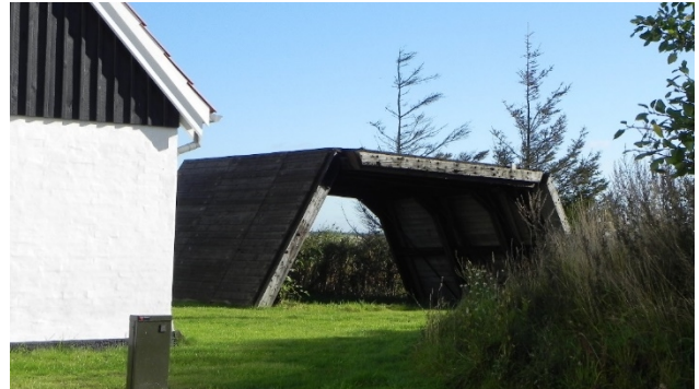
Sænkekassen; kan bruges som en slags primitiv shelter, hvis der lægges et gulv i den.

Øst for boligen står en særpræget sænkekasse i solidt tømmer. Sænkekassen blev tidligere brugt ved reparationer på slusen.