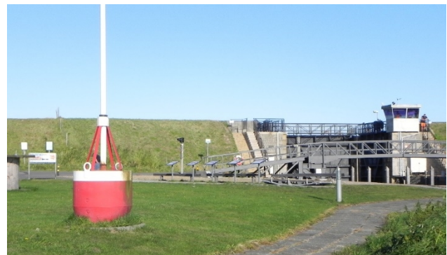
Kan græsarealet ved p-pladsen have en egentlig brugsfunktion i sommerhalvåret?

Imellem slusen, Ribe Å og klubhuset er et større græsareal. Der er opsat en gammel sømine og et sømærke på arealet.