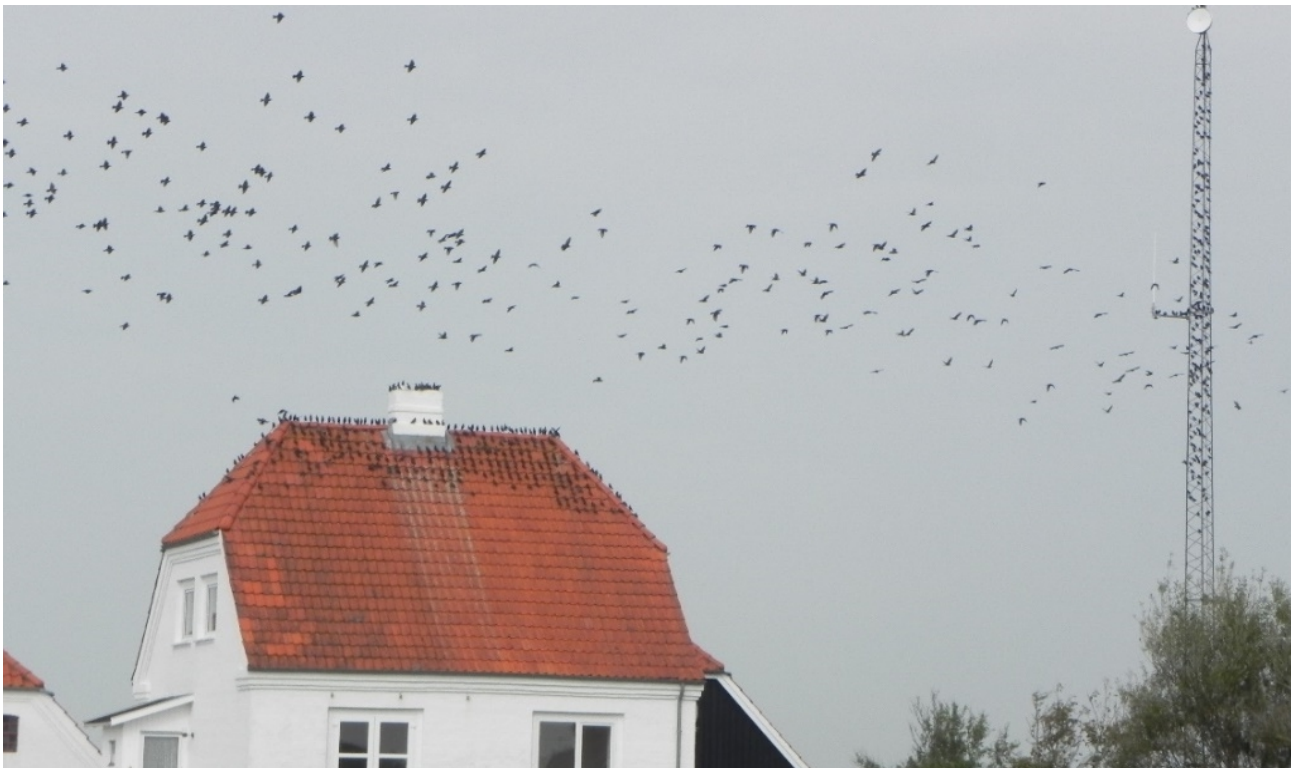
Stære samles omkring Slusemesterboligen.

Der er ikke indkommet konkrete forslag til benyttelse af selve Slusemesterboligen, men boligen vil kunne bruges som opholdslokale for de overnattende cykel- og vandreturister, hvis der etableres mulighed for automatisk adgangskontrol, og driftsomkostningerne til rengøring og vedligehold kan finansieres.