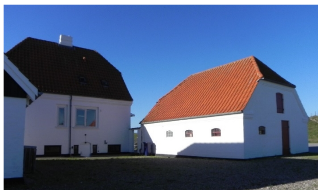
Slusemesterboligens gårdsplads. Her er der læ. Det må kunne udnyttes til udendørs undervisning.

De to sidebygninger er i brug som henholdsvis offentlige toiletter og opbevaringssted for Esbjerg Kommunes Entreprenør, Vagerlagets og slusens materiel. Den østlige fløj er tom.