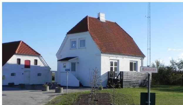
Trappen op til Slusemesterboligens hoveddør er ikke handicapegnet. Der er lavet ny handicapvenlig rampe op til terrassen.

førstesalen og bygningens eneste toilet. Der er dog handicaprampe op til terrassen og derfra adgang til stuetagen.