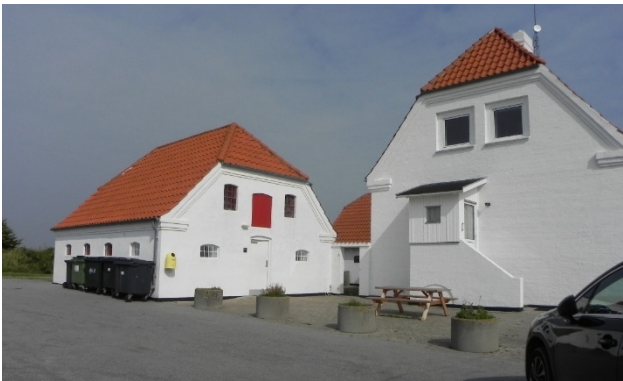
Siddepladsen ved Slusemesterboligen. Den hvide dør i vestfløjens gavl åbner ind til de offentlige toiletter.

Asfaltpladsen på vestsiden af Slusemesterboligen bruges til parkering og opstilling af flere affaldscontainere for sejlkлубben og beboerne langs Kanalstien.