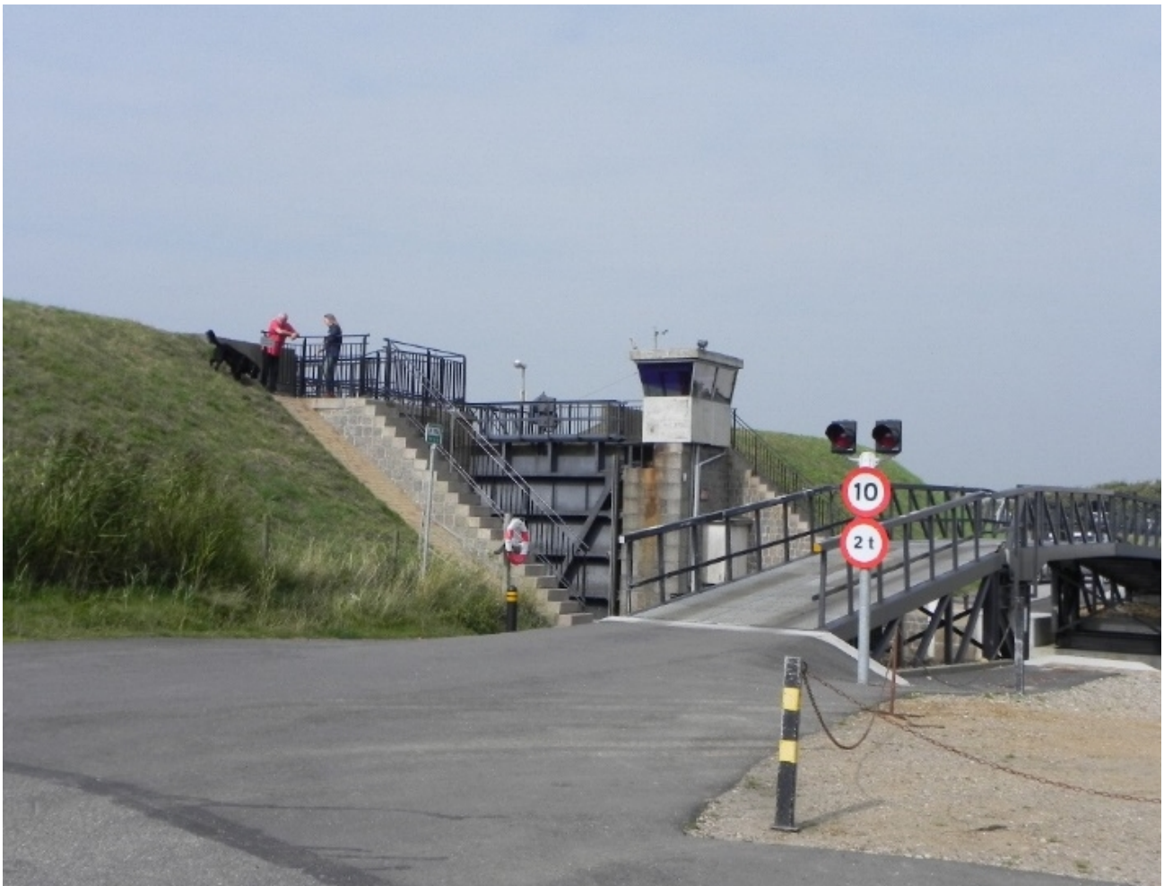
Der er et flot udsyn over Vadehavet fra toppen af slusen, men trapperne derop er meget stejle.

Naturprojekt "Vesteråen" er et partnerskabsprojekt mellem Nationalpark Vadehavet, Naturstyrelsen og Esbjerg Kommune. Der planlægges en rekreativ stiforbindelse mellem Hovedengen i Ribe og Kammerslusen gennem Ribe-marsken. Realiseringen afventer færdiggørelsen af omfartsvejen og klapbroen ved Ribe.