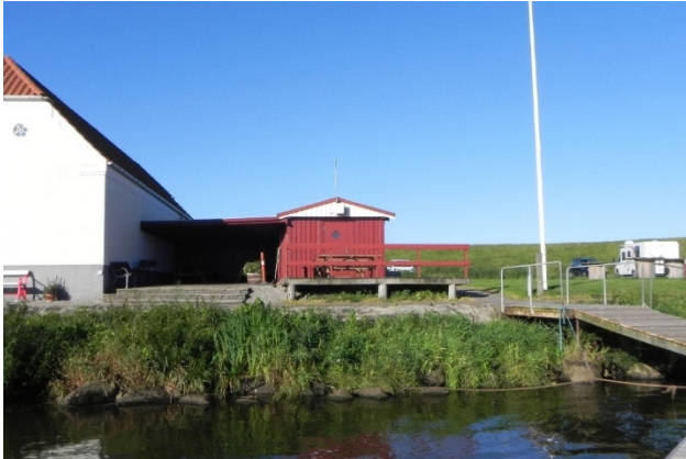
Ribe Sejlklubs røde klubhus. Der er planer om et nyt og større klubhus på stedet.

Ribe Sejlklub har i dag en stor træterrasse på læsiden af klubhuset, som må benyttes af alle.