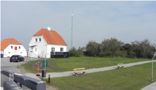
Arealet syd for Slusemesterboligen. Plænen er til ophold og også overnatning i telt.

Arealet omkring Slusemesterboligen er anlagt inden for de seneste år, hvorfor de endnu fremstår meget åbne og forblæste. Nyplantningen syd for Slusemesterboligen er meget åben og tynd, og skønnes ikke at tilføre arealet tilstrækkeligt med læ.