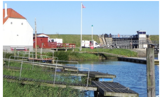
Ribe Sejlklubs mange små flydebroer. En ny stor sammenhængende flydebro er på vej som afløser.

Nationalparkskibet anvendes til formidling af nationalparken under kortere eller længere events og arrangementer samt i forbindelse med forskning og undervisning i og ved Nationalpark Vadehavet.